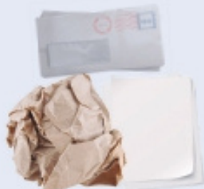
CARTES I PAPER USAT I ESCRIT