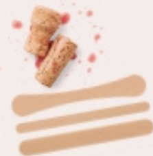
ESCURADENTS, PALS DE GELAT I TAPS DE SURO