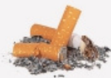
PUNTES DE CIGARRETA