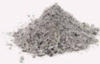
CENDRA TOTALMENT APAGADA