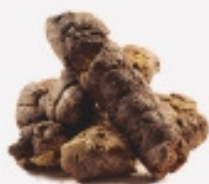
EXCREMENTS D'ANIMALS I SORRA DE GATS