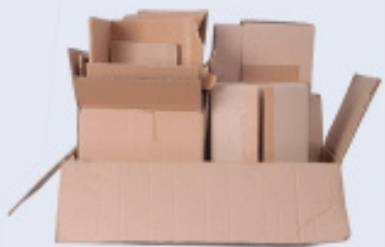
CAIXES DE CARTRÓ PLEGADES