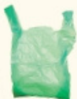
BOSSES DE PLÀSTIC