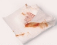
TOVALLONS I PAPER DE CUINA