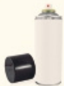
ESPREIS NO CONTAMINANTS