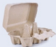
OUERES DE CARTRÓ