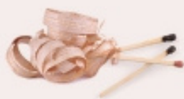
LLUMINS, I ENCENALLS DE FUSTA