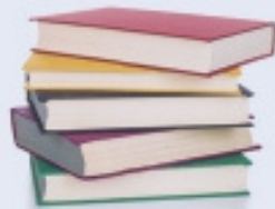
DIARIS, REVISTES, LLIBRES I LLIBRETES