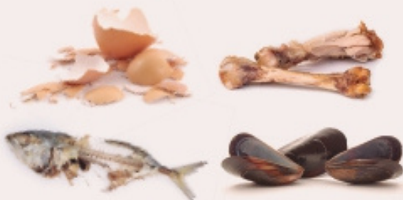
RESTES DE MENJAR