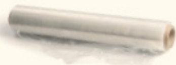
PAPER DE PLÀSTIC TRANSPARENT I PARAFINAT