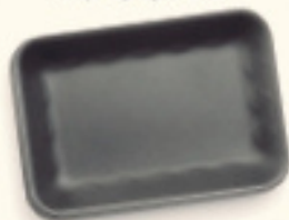
SAFATES DE POREXPAN