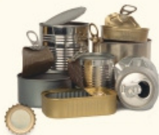
LLAUNES, XAPES, TAPS DE PLÀSTIC I METÀL·LICS