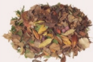
RESTES VEGETALS (MIDA PETITA)