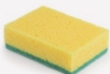
FREGALLS I DRAPS VELL