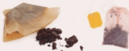
MARRO DEL CAFÈ I RESTES D'INFUSIONS